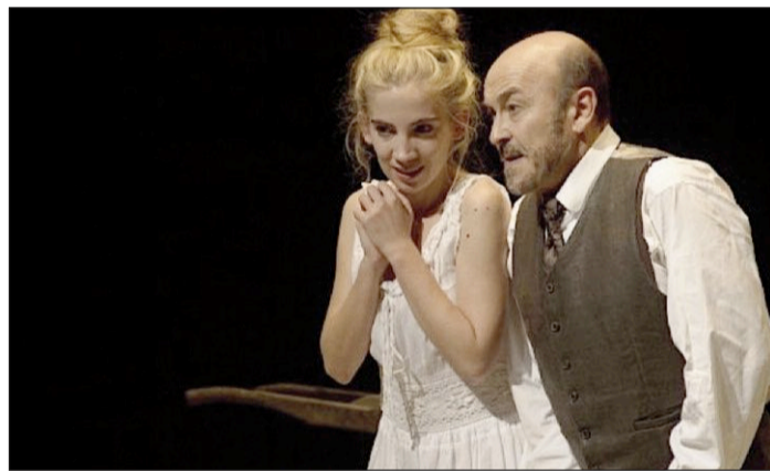
Le comédien ici dans "L'école des femmes" mis en scène par Philippe Adrien