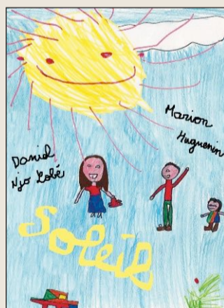
"Soleil", une histoire d'enfants sur un parking commercial...

De longues vacances de Caroline Nugues 2015 / Belgique / Animation - Fiction / 15 minutes Soleil de Sonia Joubert 2015 / France / Fiction / 11 minutes Sacré cœur d'Alphonse huynh, Hicham Harrag et Samir Harrag 2016 / France / Fiction / 9 minutes